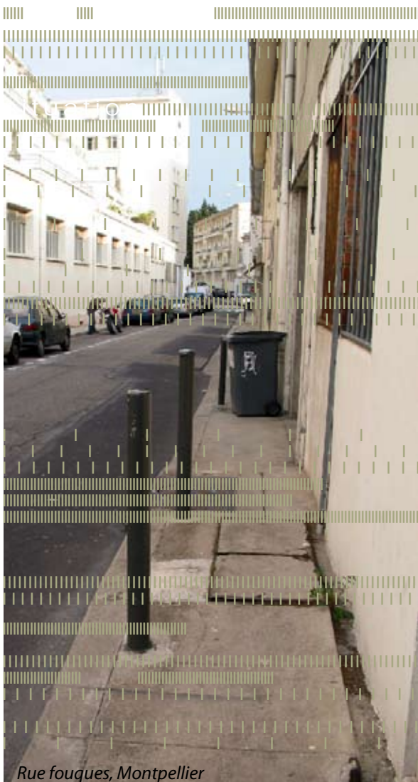
Rue fouques, Montpellier